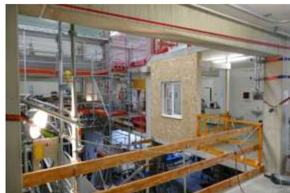
Eindrücke aus dem Praxiszentrum der BG BAU Nürnberg