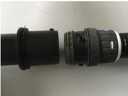
Bild: links Anschlussmuffe Kärcher alt mit Rastnase, rechts Kärcher neu mit drei Rastnasen und geänderter Ausbildung.