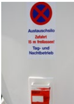
Abb. 3 Übergabemöglichkeit der Betriebsanleitung