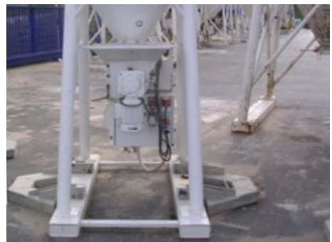
Abb. 4 Verbreiterung der Aufstandsflächen zur Erhöhung der Standsicherheit