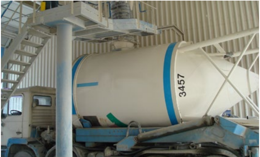
Abb. 1 Ortsfeste Beladestelle transportabler Silos

Bei transportablen Silos, die stehend befüllt werden, sind in der Regel klappbare oder schwenkbare Geländer und Übergänge an der Befüllstation vorhanden.