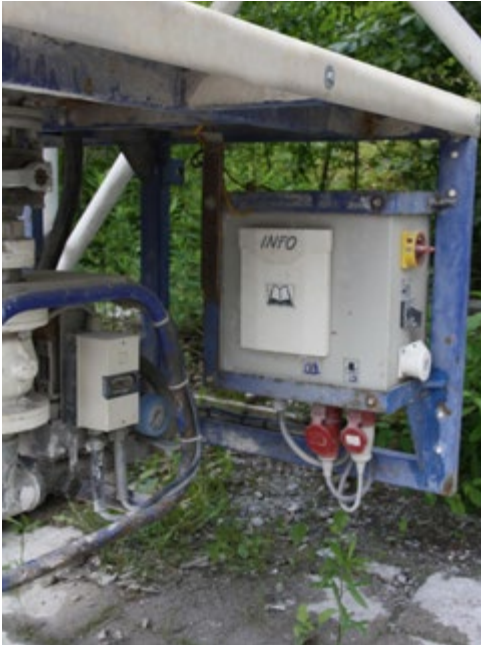
Abb. 5 Steereinheit mit Hauptschalter und Hinweisen zum sicheren Betrieb.