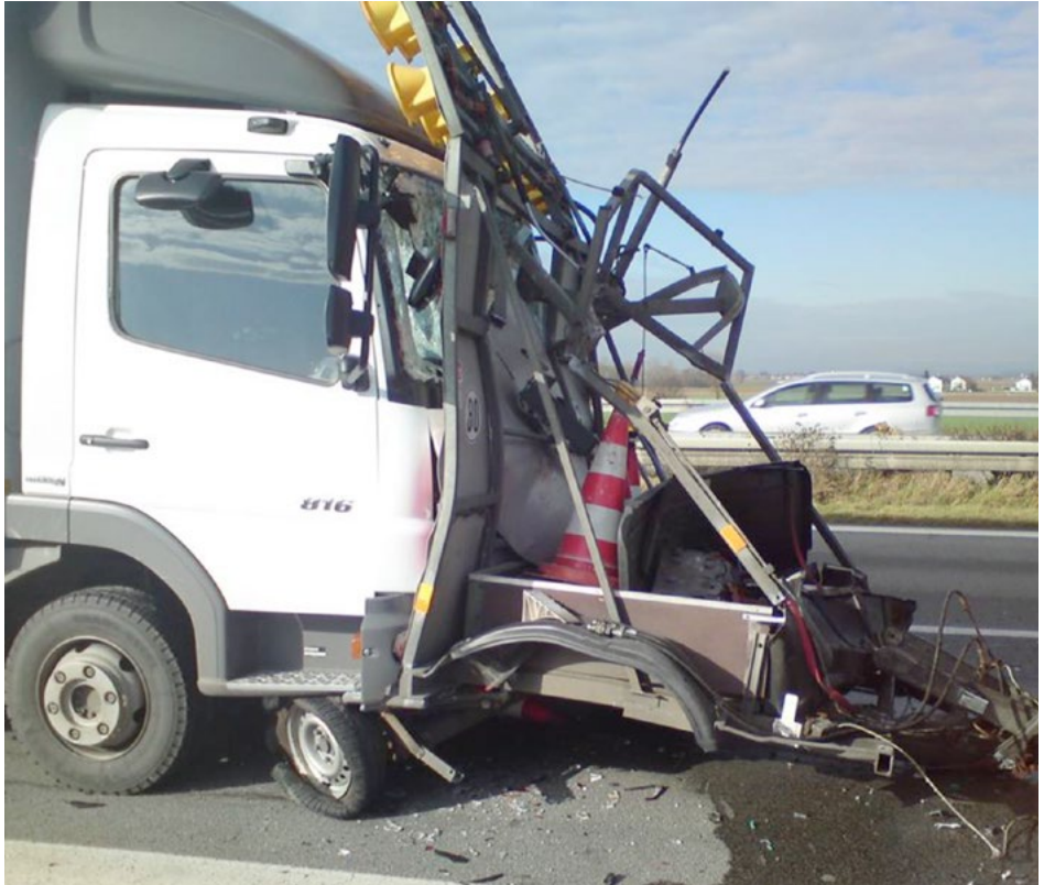
Abb. 4 LKW rammt Warnleitanhänger