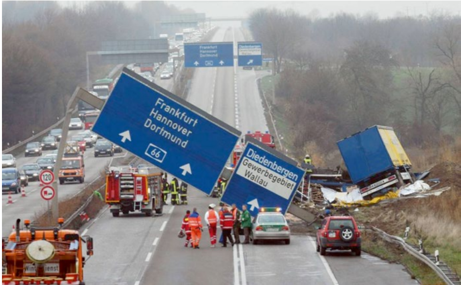
Abb. 8 Eingestürzte Schilderbrücke nach LKW-Aufprall

oder persönlich ungeeigneten Auftragnehmer ausgewählt zu haben. Die Zuverlässigkeit hinsichtlich der Sicherheit ist durch Stichproben genauso zu prüfen wie die Qualität der Auftragsausführung. Auch hier wird der Auftraggeber durch eine vertragliche Regelung entlastet.