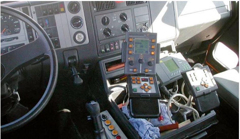
Abb. 10 Fahrerarbeitsplatz beim Winterdienst

Für Beschäftigte die bei Winterdienstseinsätzen unsicher sind, z. B. auf Grund mangelnder Erfahrung, sollte ein zweiter Beschäftigter dabei sein.