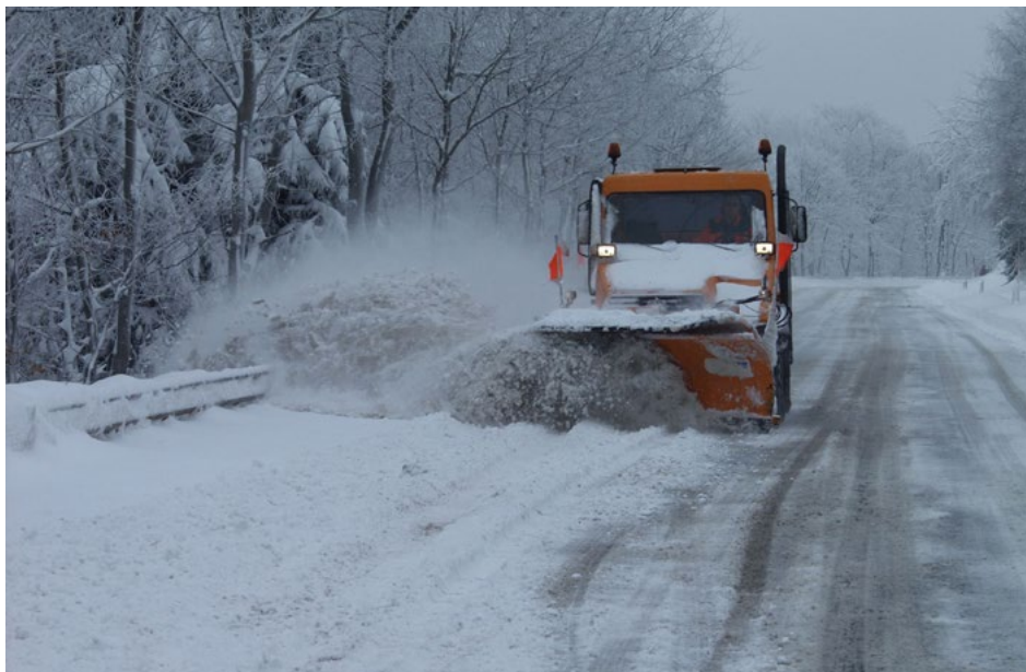
Abb. 6 Alleinarbeit im Winterdienst