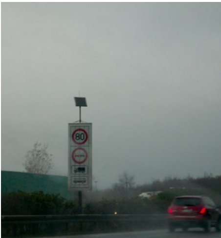
Abb. 11 Aufklappen von Schildern für eine Verkehrskontrolle mittels Fernbedienung aus einem Kontrollfahrzeug

Die Beschilderung der Anhalteplätze für die Straßenkontrollen werden zum Teil noch manuell bedient. Folglich müssen die Beschäftigten sehr gefährliche Fahrbahnüberquerungen durchführen als auch ungeschützt am fließenden Verkehr arbeiten. Hinzu kommt, dass Aufstiege zum Bedienen der Schilder zum Teil ungeeignet oder in einem schlechten Zustand sind.