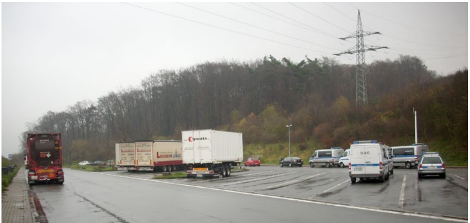
Abb. 12 Optimale Anordnung der Kontrollfahrzeuge mit ausreichend Platz, z. B. für weitere Behörden (Zoll)