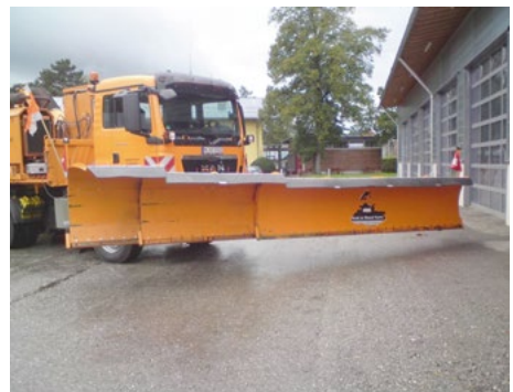
Abb. 9 Winterdienstfahrzeug mit doppelteleskopierbarem Vorbaupflug

Gut funktionierendes Winterdienstgerät bedeutet beim Einsatz weniger Stress und Belastung. Deshalb ist dessen gute Wartung vor und während des Winters sowie eine ordnungsgemäße Prüfung wichtig. Der Einsatz von optimierten Winterdienstgeräten (z. B. Schneepflüge ohne Scherbolzen) und die ordnungsgemäße Kennzeichnung des Fahrzeugs sind vorteilhaft.