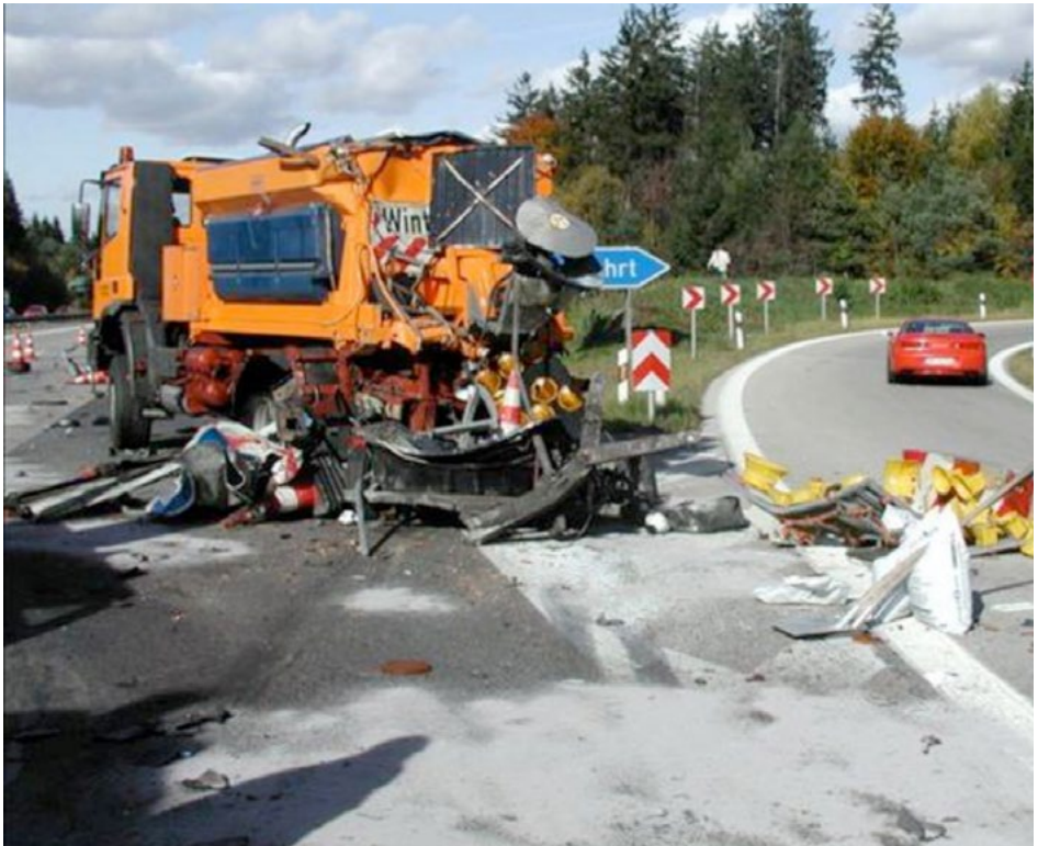
Abb. 7 Sicherungsfahrzeug nach LKW-Aufprall

Jedoch klingen die Beschwerden wiederum in aller Regel nach wenigen Tagen ab. Nur in wenigen Fällen klingen die Beschwerden nicht ab, sondern haben eine psychische Erkrankung zur Folge (z. B. Angststörung, Schmerzstörung, Suchterkrankung oder die Posttraumatische Belastungsstörung).