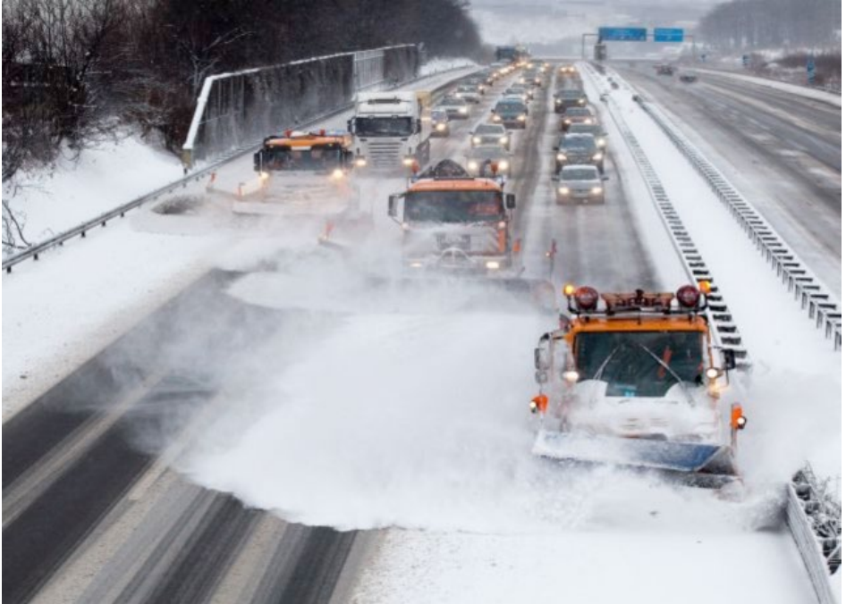
Abb. 5 Winterdienst auf der Autobahn im fließenden Verkehr