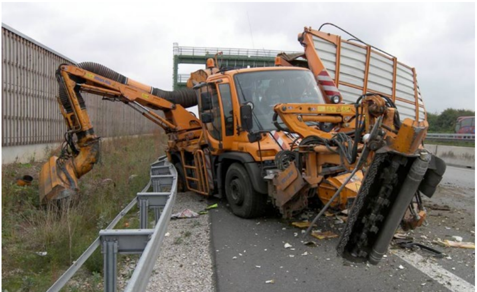
Abb. 1 Mähzug nach LKW-Auffahrunfall

die Beschäftigten mit ihrer Arbeit verbundenen Gefährdung zu ermitteln, welche Maßnahmen des Arbeitsschutzes erforderlich sind“ (§ 5 ArbSchG). Unter Maßnahmen des Arbeitsschutzes sind auch solche zur Verhütung von arbeitsbedingten Gesundheitsgefahren einschließlich Maßnahmen der menschengerechten Gestaltung der Arbeit zu verstehen. Entsprechende Maßnahmen sind mit dem Ziel zu planen, „Technik, Arbeitsorganisation, sonstige Arbeitsbedingungen, soziale Beziehungen und den Einfluss der Umwelt sachgerecht zu verknüpfen“ (§ 4 ArbSchG). Daraus lässt sich die Notwendigkeit einer Beurteilung der Gefährdung durch psychische Belastungen ableiten.