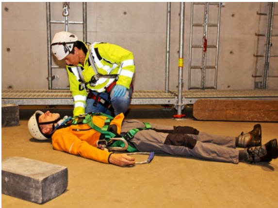
Abb. 8 Flachlagerung nach der Rettung aus der hängenden Position