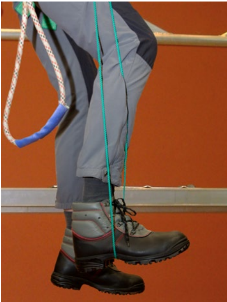
Abb. 2 Entlastung durch Stemmen eines Fußes in eine Trittschlinge

Solange eine Person noch handlungsfähig ist, kann sie unterschiedliche Maßnahmen ergreifen, um dem Blutstau in den Beinen entgegen zu wirken. Dazu ist es notwendig, dass die im Gurt hängende Person die Beine bewegt. Effektiver ist es, die Beine abzustützen und gegen einen Widerstand zu drücken. Hierfür sind Trittschlingen, z. B. ein Halteseil mit Längeneinstellvorrichtung oder eine Prusikschlinge geeignet. Damit kann sich die frei hängende Person entlasten, die „Muskelpumpe“ kann in Gang gehalten und eine eventuelle Einschnürung im Oberschenkel gelöst werden.