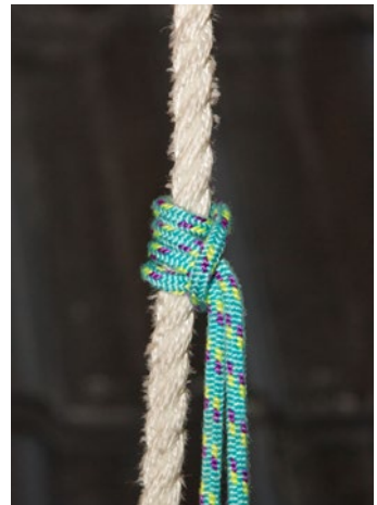
Abb. 5 Prusikknoten