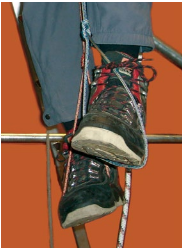
Abb. 6 Abwechselnde Be- und Entlastung der Füße in der Prusikschlinge

Sollte kein Halteseil mit Längeneinstellvorrichtung oder keine Prusikschlinge zur Verfügung stehen, kann sich die frei im Seil hängende Person wechselweise jeweils mit einem Fuß fest auf den anderen Fuß treten. Dabei wird der untere Fuß kräftig mit den Zehen nach oben gezogen. Dies hält allerdings nur für eine sehr kurze Zeit (wenige Minuten) den Rückfluss des Blutes aus den unteren Extremitäten in Gang.