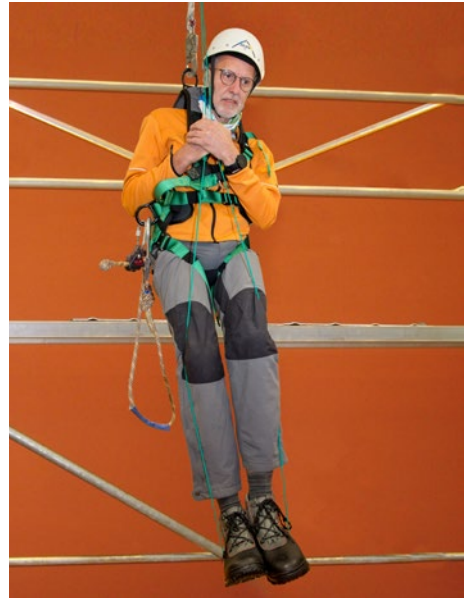
Abb. 3 Entlastung durch stemmen beider Füße in eine Trittschlinge