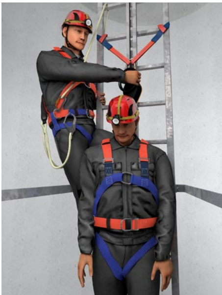
Abb. 7 Rettung einer verunfallten Person von einer Steigschutzeinrichtung

Einzelheiten zu möglichen Rettungsmaßnahmen bzw. deren Planung enthält die DGUV Regel 112-199 „Retten aus Höhen und Tiefen mit persönlichen Absturzsicherungsgeräten“.