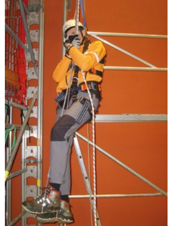
Abb. 4 Anwendung der Prusikschlinge

Die Prusikschlinge wird bereits vor Arbeitsbeginn für den „Ernstfall“ vorbereitet und leicht zugänglich und erreichbar – z. B. in einer Schutztasche am Auffanggurt – verstaut.