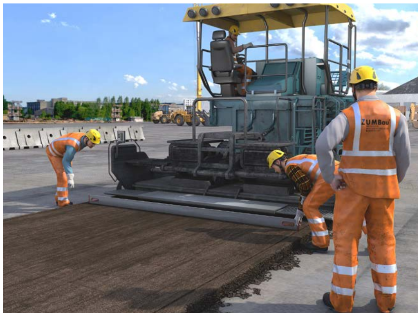
Abb. 8 Beispiel für die Prüfung zum „Geprüften Fahrer von Straßenfertigern“ nach ZUMBau-Standard