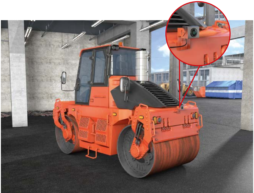
Abb. 2 Sichteinschränkung durch nachgerüsteten PDF DPF wird durch technisches Hilfsmittel ausgleichend, hier durch Kamera-Monitor-System

Siehe auch § 7 DGUV Vorschrift 38 „Bauarbeiten“.