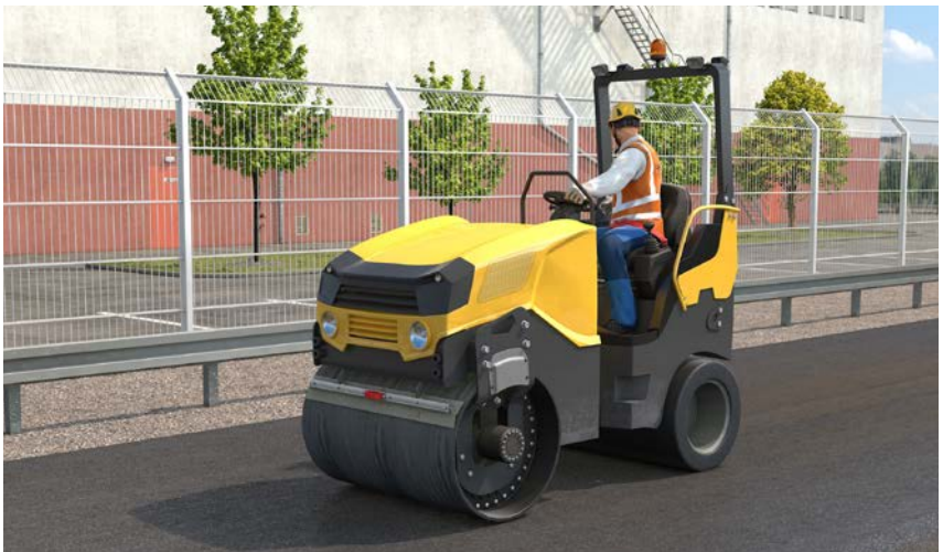
Abb. 12 Überrollschutzeinrichtung und Sicherheitsgurt bieten Schutz bei Umsturz

Werden Straßenwalzen mit klappbarem Überrollschutz eingesetzt, muss dieser aufgeklappt und arretiert sein. Zusätzlich muss der Haltegurt angelegt sein.