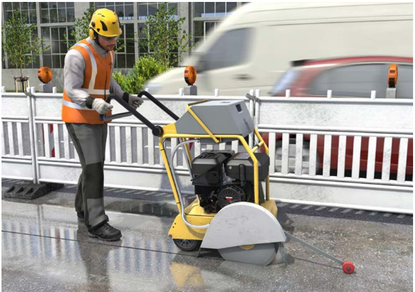
Abb. 15 Staubminimierung durch Nassschneiden

5.7.2 Fugenschneider dürfen nur mit geeigneten (Herstellerangaben) und unbeschädigten Schneidscheiben verwendet werden.