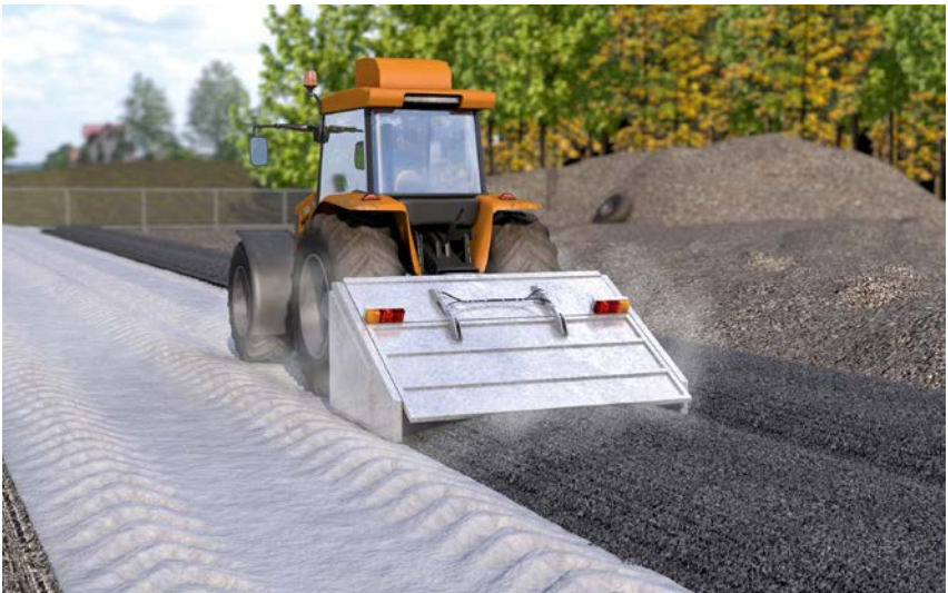
Abb. 14 Bodenstabilisierung