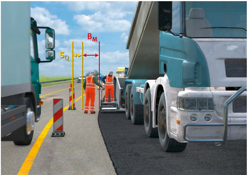
Abb. 19 Sicherheitsabstände

Bei Arbeiten im Grenzbereich zum fließenden Straßenverkehr ist der erforderliche Platzbedarf für Arbeitsplätze, Verkehrswege, Sicherheitsabstände und technische Schutzeinrichtungen auf Grundlage der Technische Regel für Arbeitsstätten (ASR) A5.2 „Anforderungen an Arbeitsplätze und Verkehrswege auf Baustellen im Grenzbereich zum Straßenverkehr – Straßenbaustellen“ festzulegen. Können die Mindestmaße aus der ASR A5.2 nicht eingehalten werden, sind als Ergebnis einer Gefährdungsbeurteilung Schutzmaßnahmen festzulegen, die mindestens die gleiche Sicherheit und den gleichen Gesundheitsschutz für die Beschäftigten erreichen.