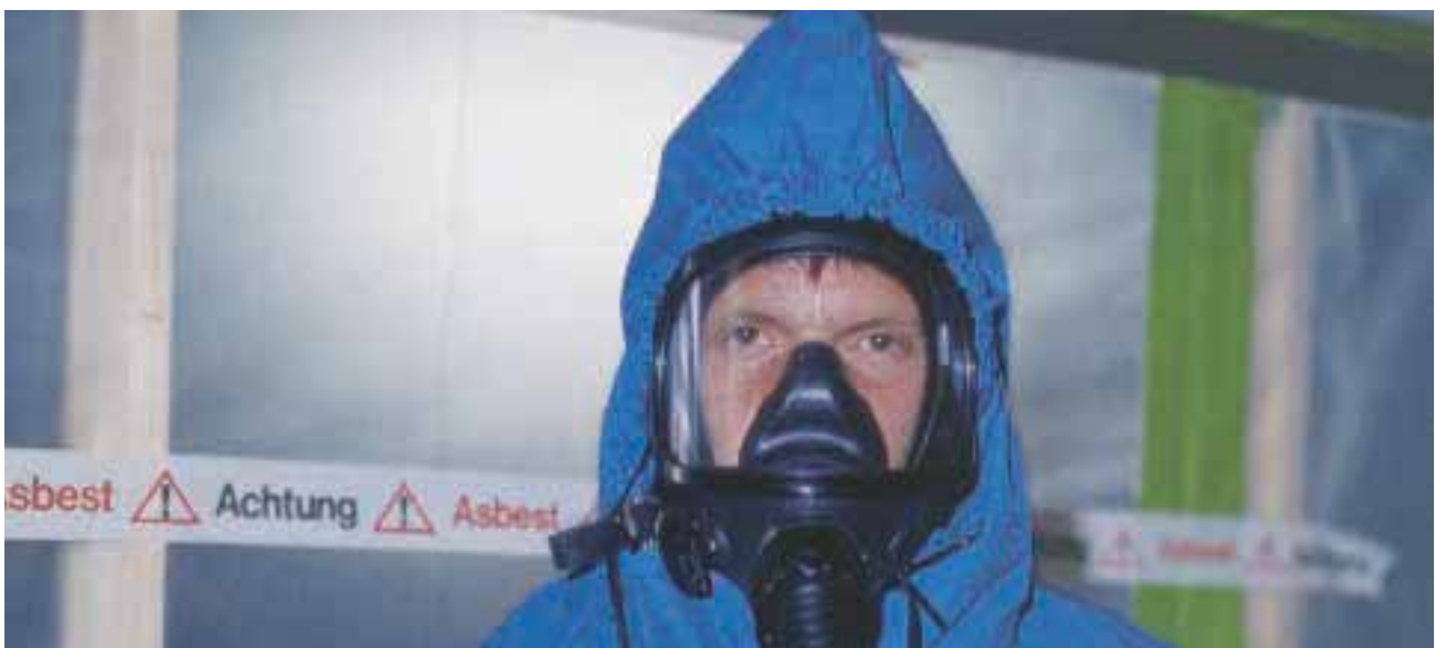
Mitarbeiter mit gebläseunterstütztem Atemschutz vor einer vorschriftsmäßig gekennzeichneten Abschottung.