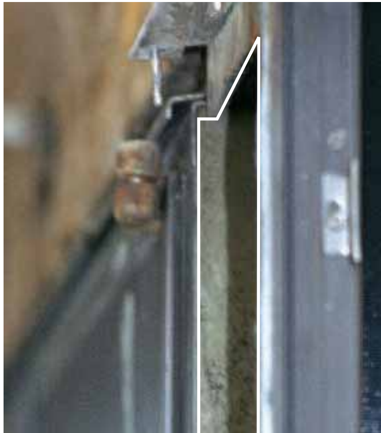
Bei dem markierten Bereich handelt es sich um die Spritzasbest-Ummantelung einer Stahlbaustütze (vor dem Abbruch).