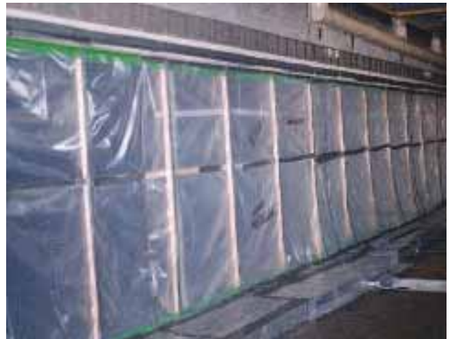
Luftdichte Abschottung - Trennung zwischen Schwarzbereich und Weißbereich.

„Löwengang“. Die Verbindung zwischen zwei Entsorgungsbereichen werden durch so genannte Löwengänge hergestellt. Dabei handelt es sich um allseitig abgeschottete Verkehrswege (Abb. rechts).