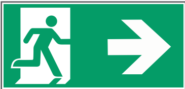
E002 Beispiele für Rettungsweg/Notausgang mit Zusatzzeichen (Richtungspfeil)