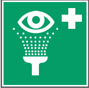
E011 Augenspül- einrichtung