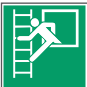
E016 Notausstieg mit Fluchtleiter