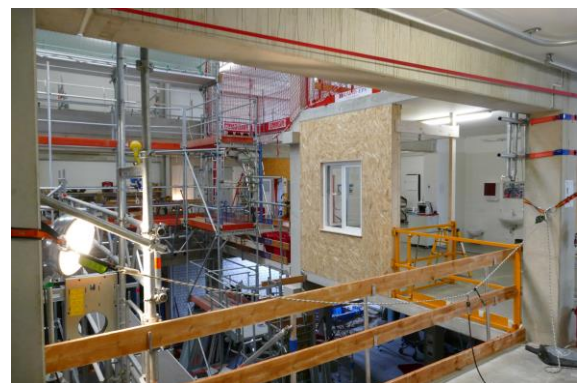
Eindrücke aus dem Praxiszentrum der BG BAU Nürnberg